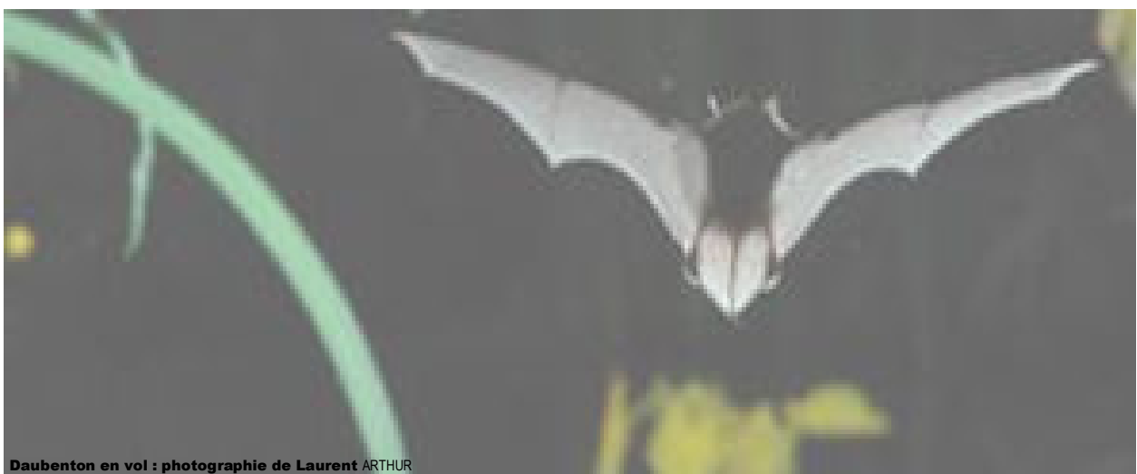
Daubenton en vol

Dans cette exposition, créée pour vous faire découvrir cet animal nocturne, tant mal connu que mal aimé, vous apprendrez, de façon ludique et pédagogique, qu'il est le seul des mammifères à savoir voler. Ce n'est donc pas, contrairement aux idées reçues, un oiseau. En France, cet animal insectivore chasse des milliers de moustiques et de papillons de nuit et joue ainsi un rôle écologique très important.